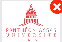
Ne pas changer la couleur