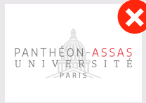
Ne pas désolidariser la coupole et le texte