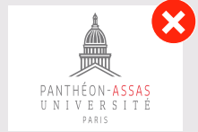
Homothétie non respectée