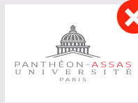
Homothétie non respectée