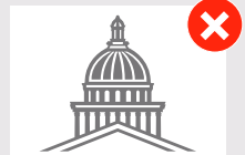
Ne pas utiliser la coupole seule